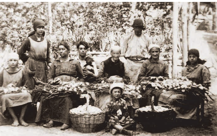
Famiglia contadina Lagarina dei primi anni '900.