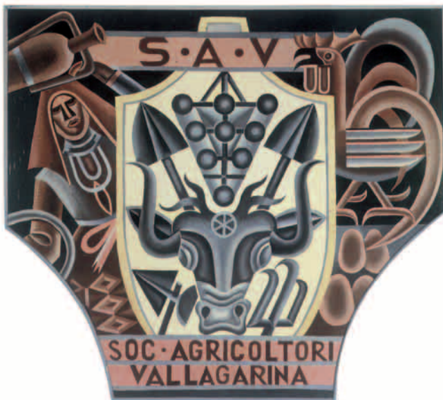
Marchio della Società Agricoltori Vallagarina, dipinto dal pittore futurista Fortunato Depero.

Dalla fine di settembre 2004 l'Azienda ha ottenuto e mantiene un sistema di gestione qualità, che è conforme alla norma UNI EN ISO 9001: 2000, per l'attività di vinificazione d'uve conferite dai soci, lavorazione vini, imbottigliamento e vendita.