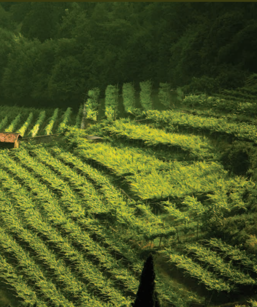
Vigneti di Nosiola in località Sant' Antonio a Pomarolo.